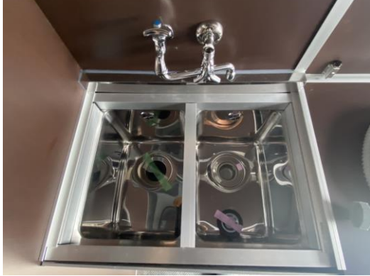
2槽シンク（蓋スライド）