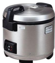
電気炊飯ジャー 4000円/日～