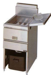
ガスフライヤー 8000円/日～