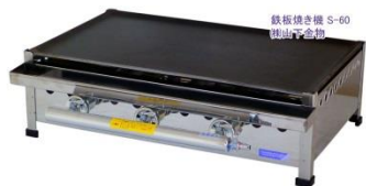
グリドル (鉄板) 4000円/日