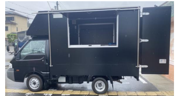
販売面(左側) (販売口間口)