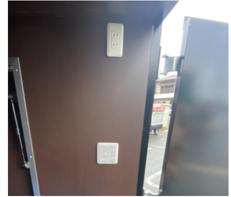
スイッチ、コンセント差込口 （運転席側後方）