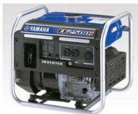
発電機 7000円/日 7時間分の燃料費含む