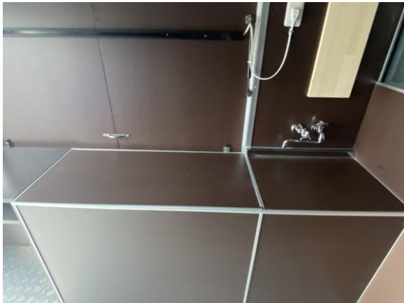
作業台 (2槽シンク蓋つき)