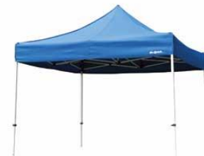
簡易テント 2m×2m他 4000円/日～