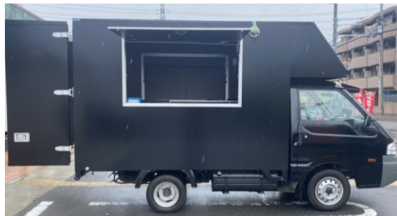
販売面(右側) (販売口間口)