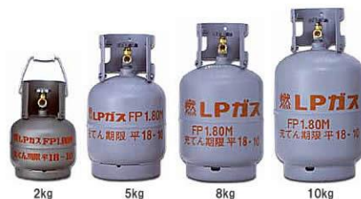
LPガスボンベ 2000円/本 ガス代：450円/kg