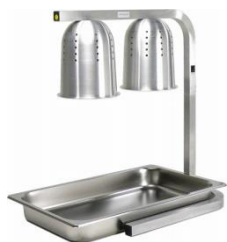
ホットウォーマー 2000円/日