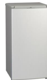
縦型冷蔵庫 (100 L) 5000円/日～