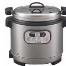
スープジャー 4000円/日～