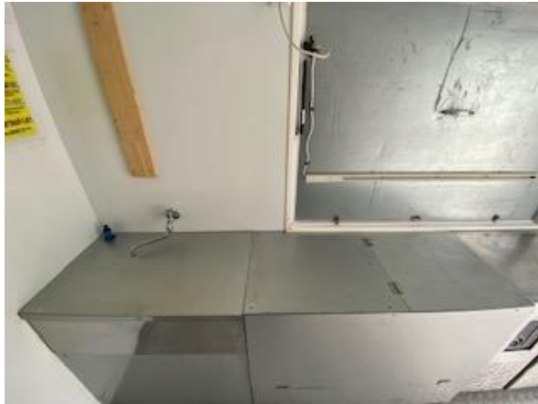
作業台、2槽シンク (蓋つき) (200Lタンク)