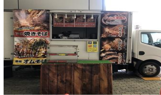
営業風景 (前出しあり)