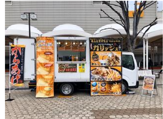
営業風景 (前出しなし)