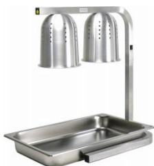
ホットウォーマー 2000円/日