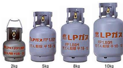
LPガスボンベ 2000円/本 ガス代：450円/kg