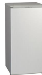
縦型冷蔵庫 (100 L) 5000円/日～