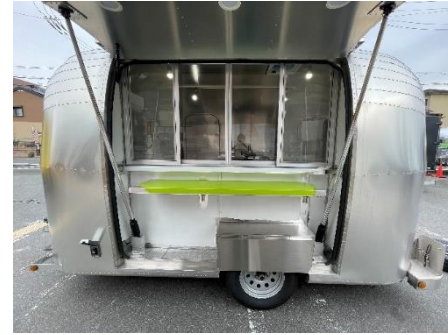
販売口 (開店時・外側)