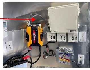
全体主電源 ブレーカーBOX