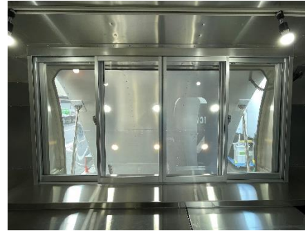
販売口 (閉店時・内側)