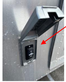
販売口跳ね上げ開封スイッチ