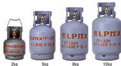
LPガスボンベ 2000円/本 ガス代：450円/kg