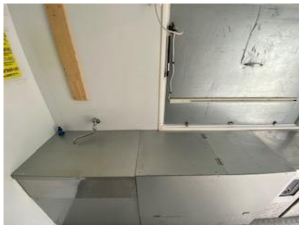
作業台、2槽シンク (蓋つき) (200Lタンク)