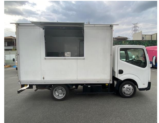
販売面 (販売口間口)