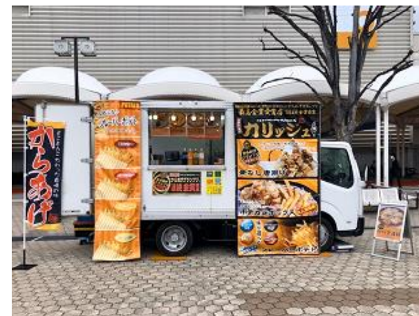
営業風景 (前出しなし)