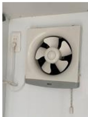
換気扇 (助手席後方)