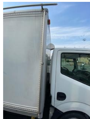
看板取り付け可能 フレーム