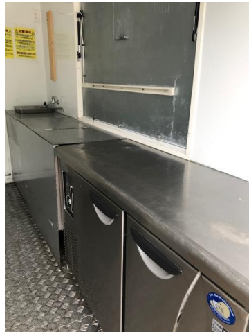
作業台、冷蔵庫 (冷蔵庫オプション)