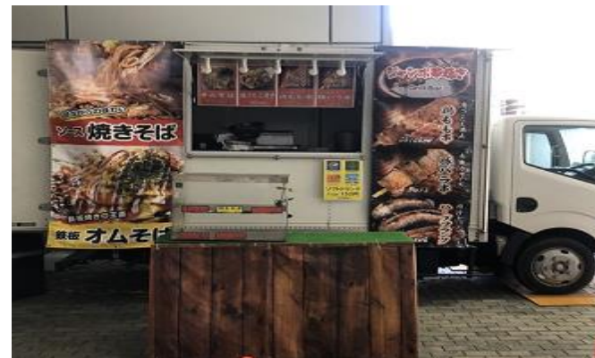
営業風景 (前出しあり)