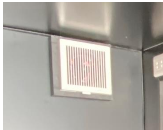
換気扇 (運転手席後方)