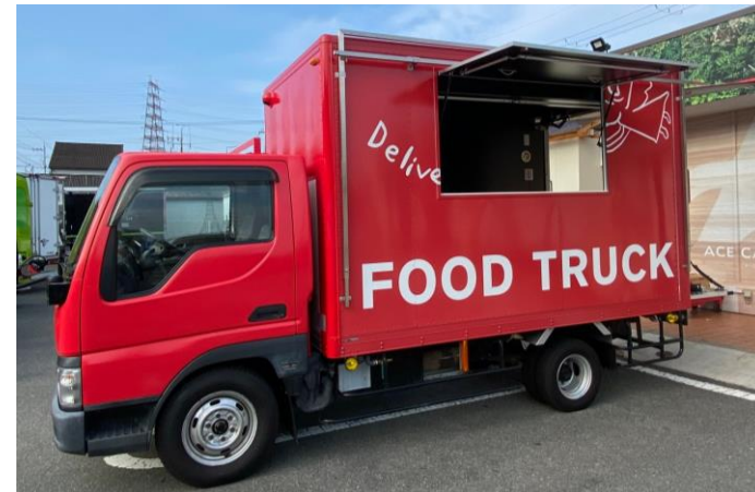
販売面 (販売口間口)