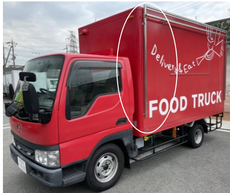
看板取り付け可能 フレーム