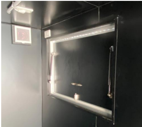
換気窓 (運転席側後方)