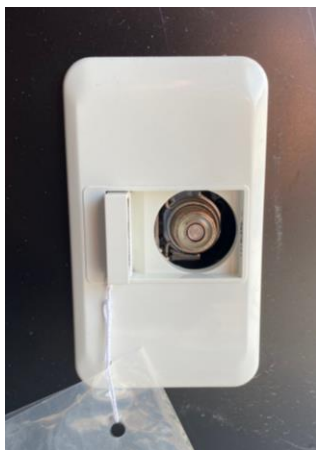
LPガス差し込み接続口 (4か所) ※壁内ガス配管