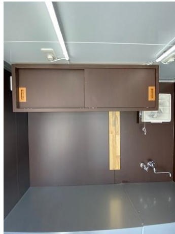
作業台 (2槽シンク蓋つき)