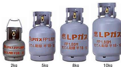
LPガスボンベ 2000円/本 ガス代：450円/kg