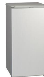
縦型冷蔵庫 (100 L) 5000円/日～