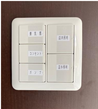
照明スイッチ (運転席側後方)